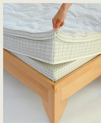
Klimahaube - stülpt sich über die Kerne und sorgt für ein gutes Bettklima