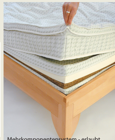
Mehrkomponentensystem - erlaubt den Austausch jedes Einzelelements