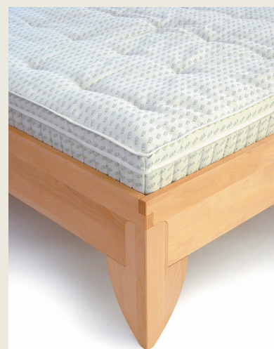
Kerne - Naturlatex und/oder Kokos