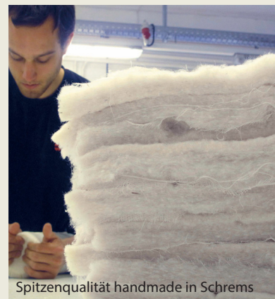
Spitzenqualität handmade in Schrems

ist kuschelig und weich aber nicht so langlebig, ca 9 - 12 Jahre. Die Auflage ist wenig formstabil, da die Baumwolle sich auf Druck zusammenlegt. Baumwolle ist auch sehr saugfähig, daher auch schwer zu trocknen.